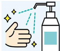
手指の消毒スプレー