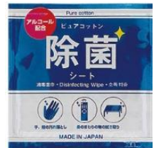
除菌ウェットシート